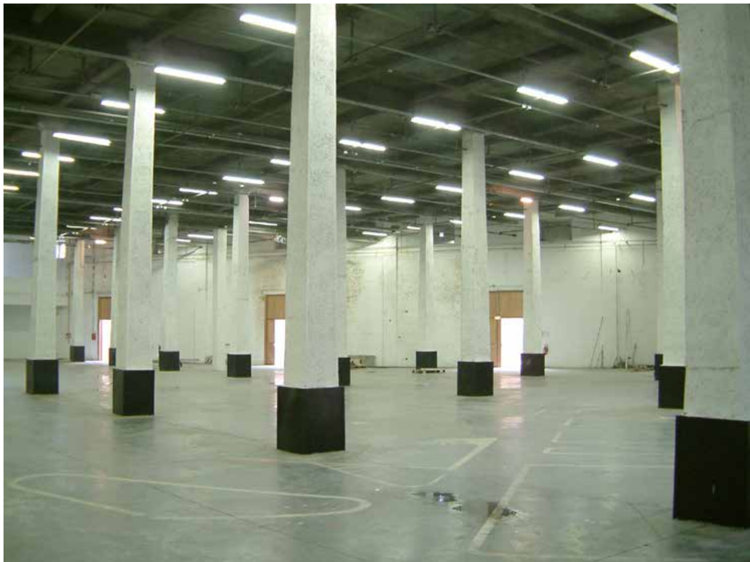
Vues de la Halle B